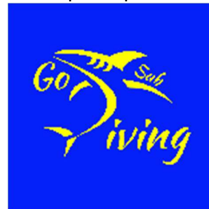
Logo di GODiving