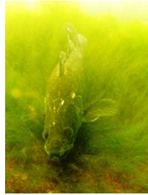
Luccio perca a Porto Ceresio