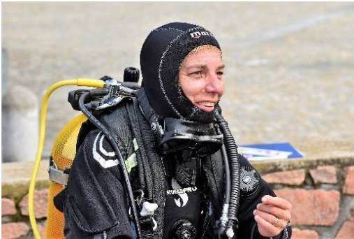
Pronti per l'immersione