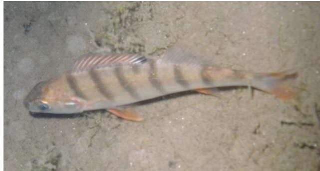
Un pesce persico