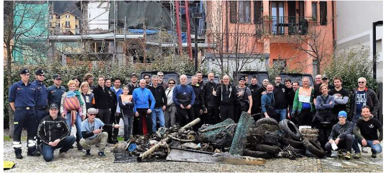
La pulizia del Ceresio 2018