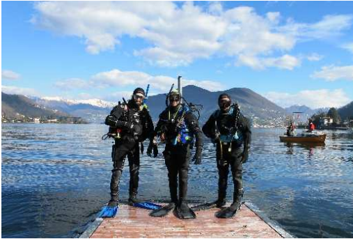
Gli istruttori di GODiving